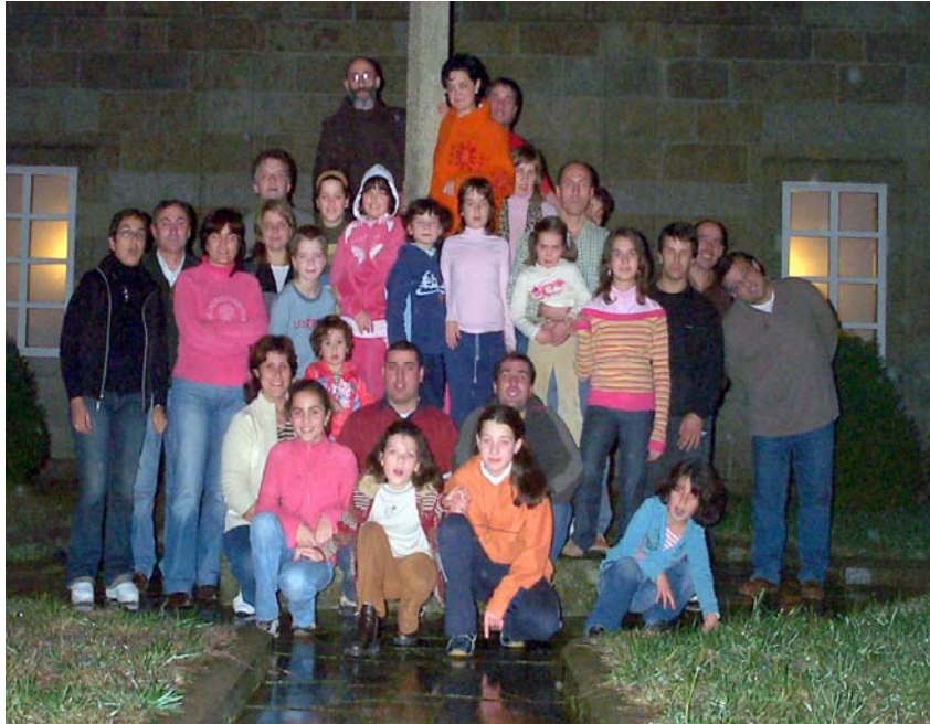
Foto de grupo Retiro Adviento 2007

○ Retiros, ya sean en el propio convento o fuera. Normalmente de uno a 3 días en una población cercana (Trives, Herbón,...).